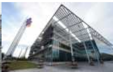
Copil formation FSE