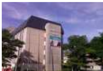
CDIAE 67 SPEP

Nous avons participé à 96 rencontres institutionnelles en 2016.