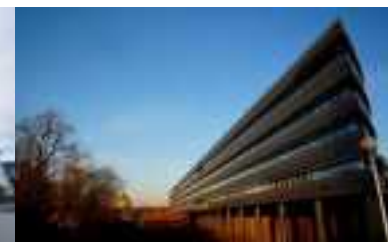
Comité usagers Insertion bRSA