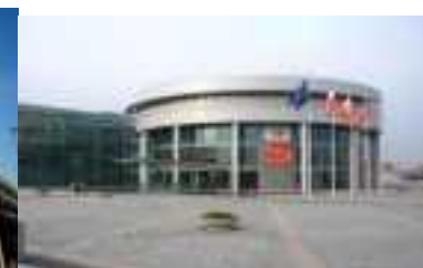
Formation Insertion bRSA